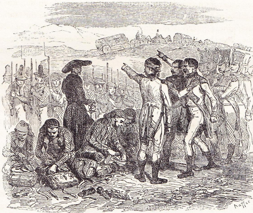
L'affaire d'Andujar fut jugée par l'indignation de la France et par l'exaltation